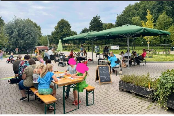
Project Ontmoetingspark Buiten!