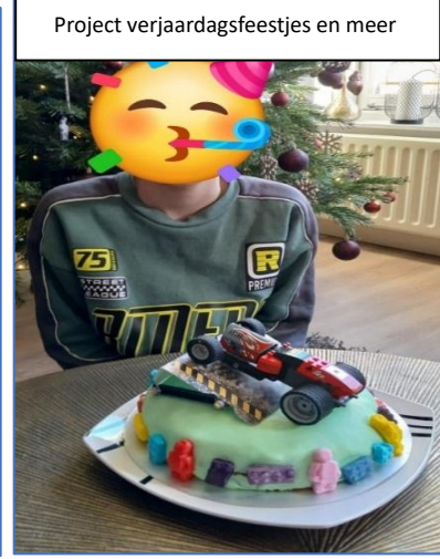
Project verjaardagsfeestjes en meer