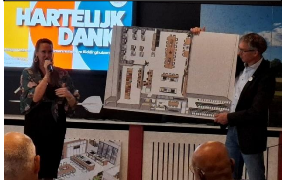
Project Inloophuis Biddinghuizen